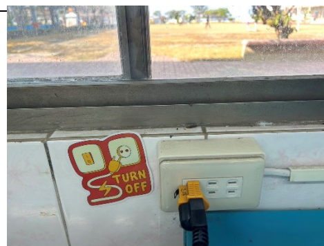
張貼節約用電標語在插座旁邊