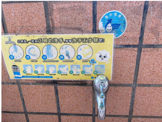
加裝省水水龍頭，低碳節能