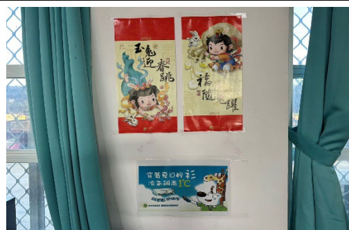
張貼節電標語在牆面上，提醒學生低 碳節能，進而培養良好習慣