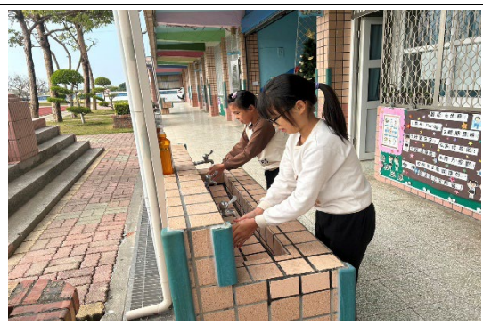
加裝省水水龍頭，低碳節能