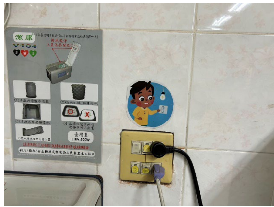
張貼隨手關燈標語在開關旁邊