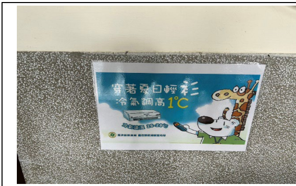
辦公室牆面張貼節約能源標語