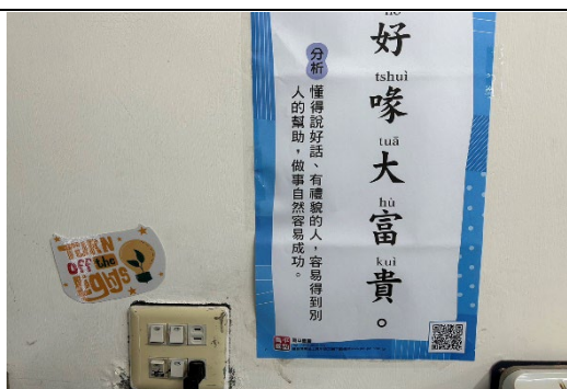
張貼節約用電標語在插座旁邊